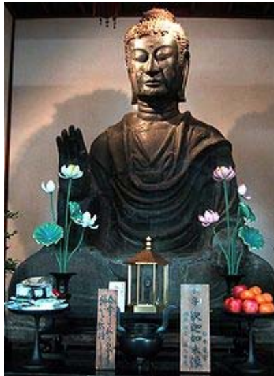
Het Shaka beeld van Asukadera, 606

Zijn eerst gekende werk is een bronzen Shaka beeld van Asuka-dera, voltooid in 606 Asuka in Nara. Dit werk maakte goede impressie op de toenmalige keizerin Suiko.