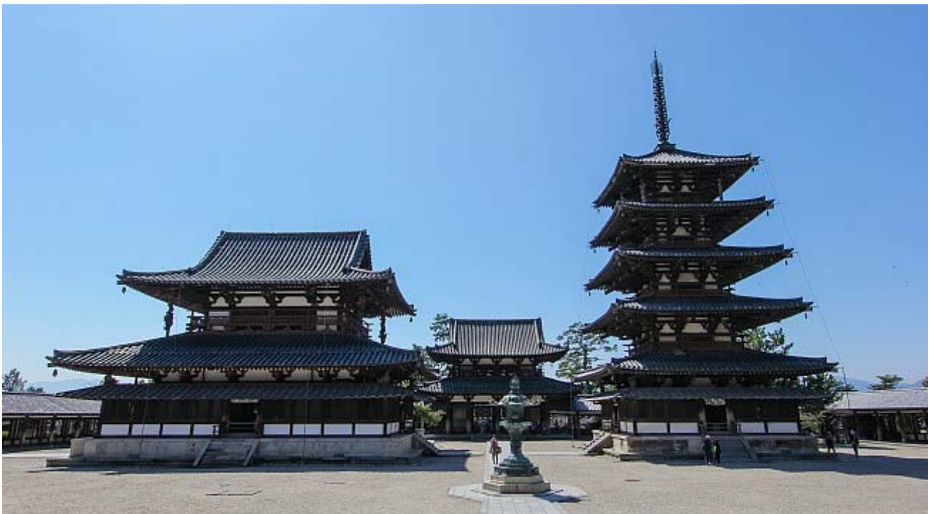
Westelijk terrein : hoofdhal, hoofdingang en de vijf-verdiepen pagode