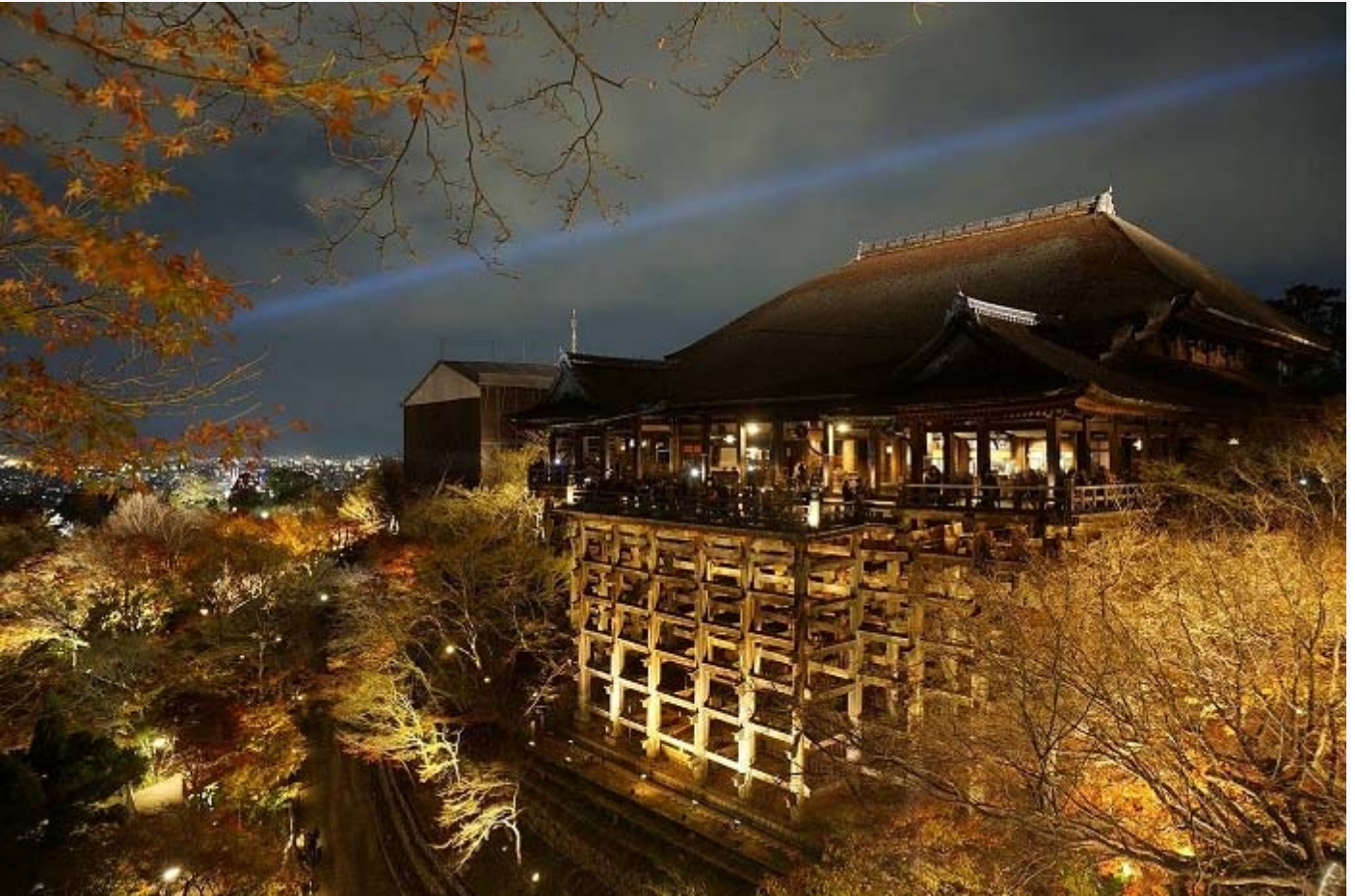
(Het tempelcomplex tijdens het Hanatoro lichtfestival)

Tijdens Hanatoro – een lichtfestival – kun je de tempel ook in de avond bezoeken. Dan kun je vanaf de veranda's uitkijken over het prachtig verlichte Kyoto. De tempel zelf is dan helemaal verlicht wat een absolute aanrader is voor een romantisch uitje!