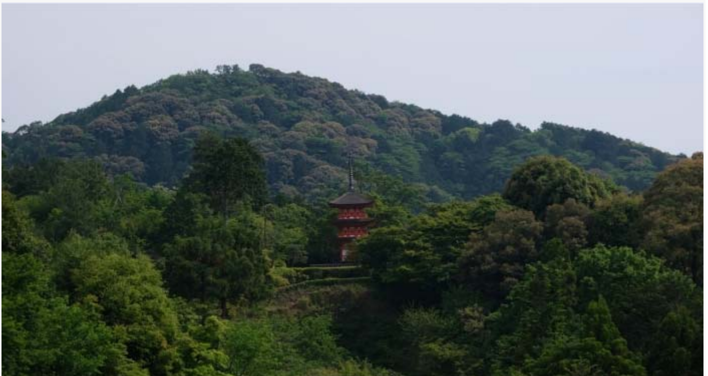
(Koyasu Pagoda in de heuvels rondom Kyoto)

Net zoals veel andere tempels in Japan bestaat dit Kiyomizu-Dera niet uit slechts één gebouw. Het is eerder een uitgebreid complex met meerdere kamers, schrijnen en tempelgebouwen. Een groot deel hiervan kan worden bezocht.