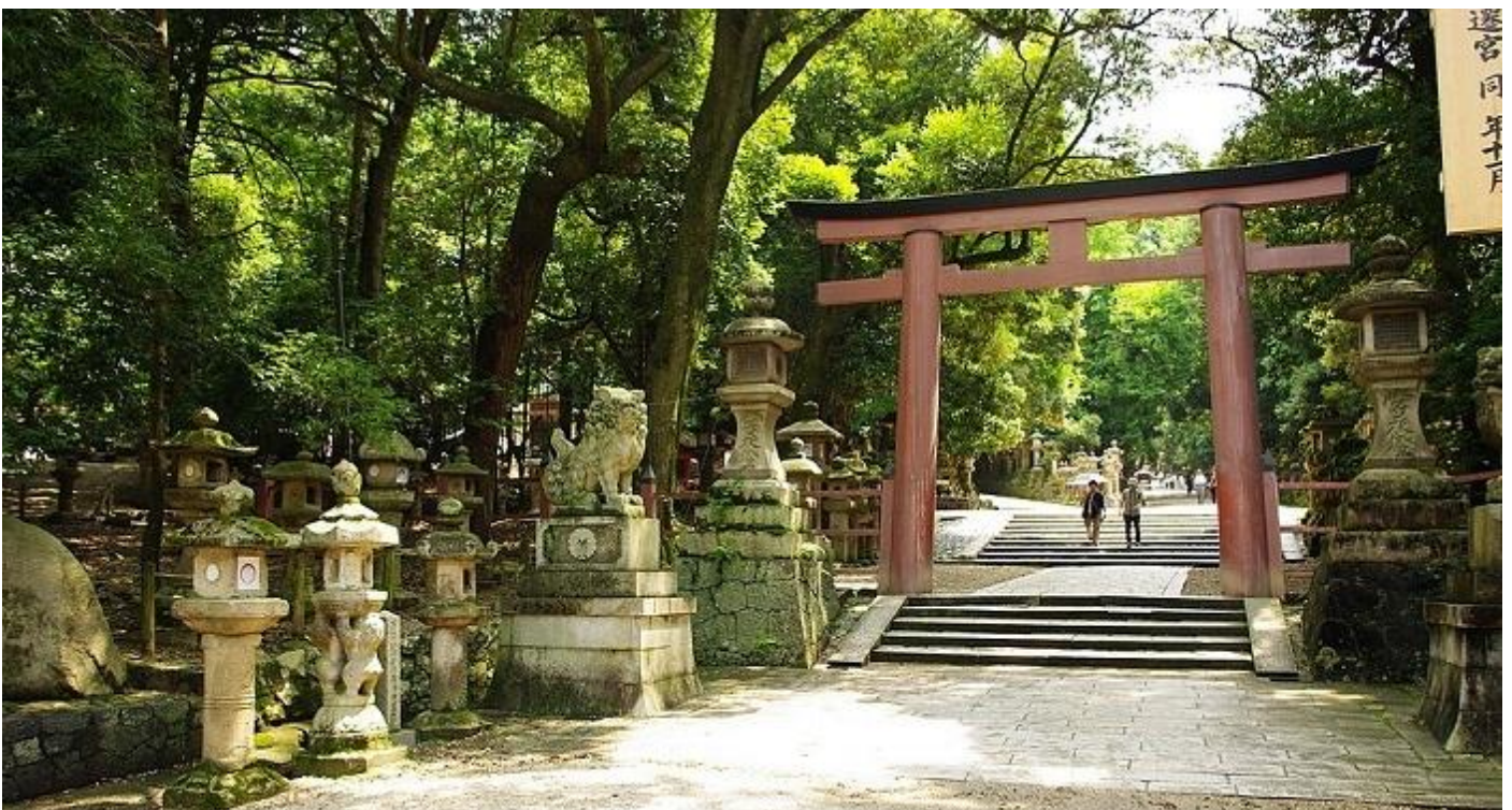
Torii van Kasuga Grand Shrine in het park

In januari 2023 onthulde een gezamenlijk onderzoeksteam van Fukushima University, Yamagata University en Nara University of Education dat onder de sikaherten die het Kii-schiereiland bewonen, die in Nara Park een unieke genetische populatie vormen.