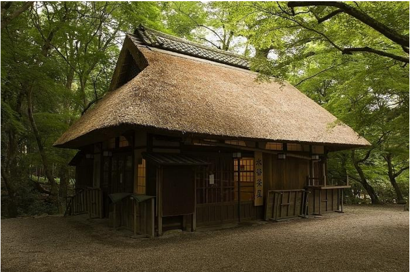
Chaya in het park, biedt thee en wagashi aan

De wilde dieren die het park bewonen zijn herten, wilde zwijnen, Japanse wasbeerhonden, Japanse gigantische vliegende eekhoorns, eekhoorns en anderen. De vegetatie bestaat onder andere uit pijnbomen, kersenbloesembomen, esdoorns, pruimenbomen, Japanse ceder en Japanse pieris.