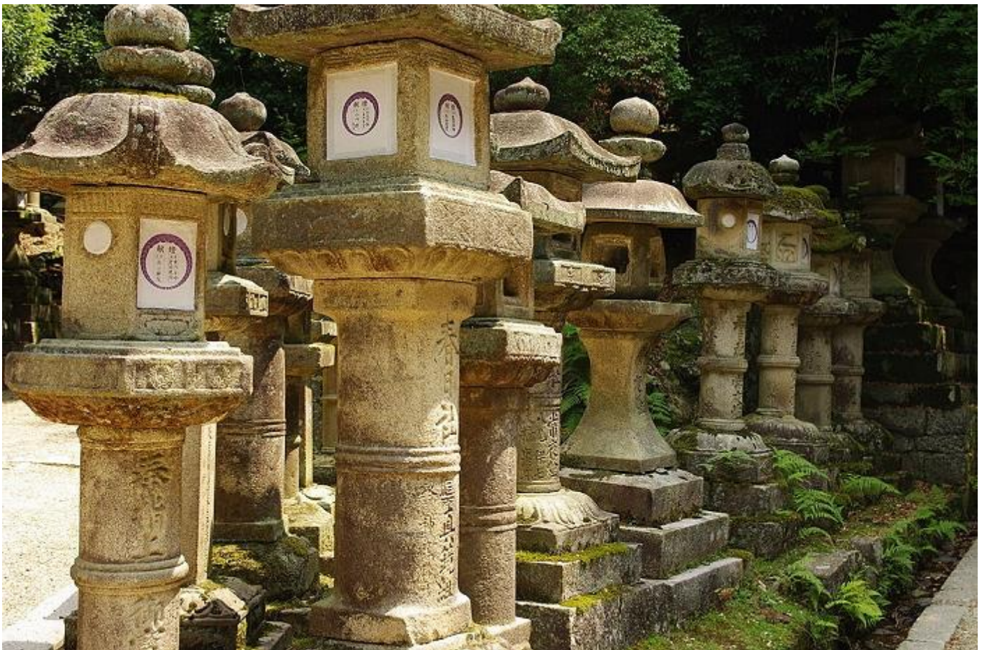
Meer dan 1000 Kasuga Shrine-lantaarns sieren het park

De resultaten van het grootschalige genetische onderzoek toonden aan dat terwijl 18 mitochondriale DNA-genotypes werden gedetecteerd in herten die op het Kii-schiereiland leven, slechts één van deze genotypen werd gedetecteerd in herten die in Nara Park leven, wat niet wordt gevonden in herten die in andere gebieden leven. van het Kii-schiereiland. De genetische differentiatie van de Nara Park-herten van de hertenpopulatie op het Kii-schiereiland vond ongeveer 1400 jaar geleden plaats, wat genetisch dicht bij het jaar 768 ligt, toen de Kasuga Grand Shrine werd gebouwd. De resultaten van dit onderzoek bevestigen dat het Japanse volk de herten in dit gebied al meer dan 1000 jaar beschermt als boodschappers van Takemikazuchi, de belangrijkste godheid van Kasuga Grand Shrine, en dat dit de herten in dit gebied in staat heeft gesteld hun populatie te behouden. van generatie tot generatie.