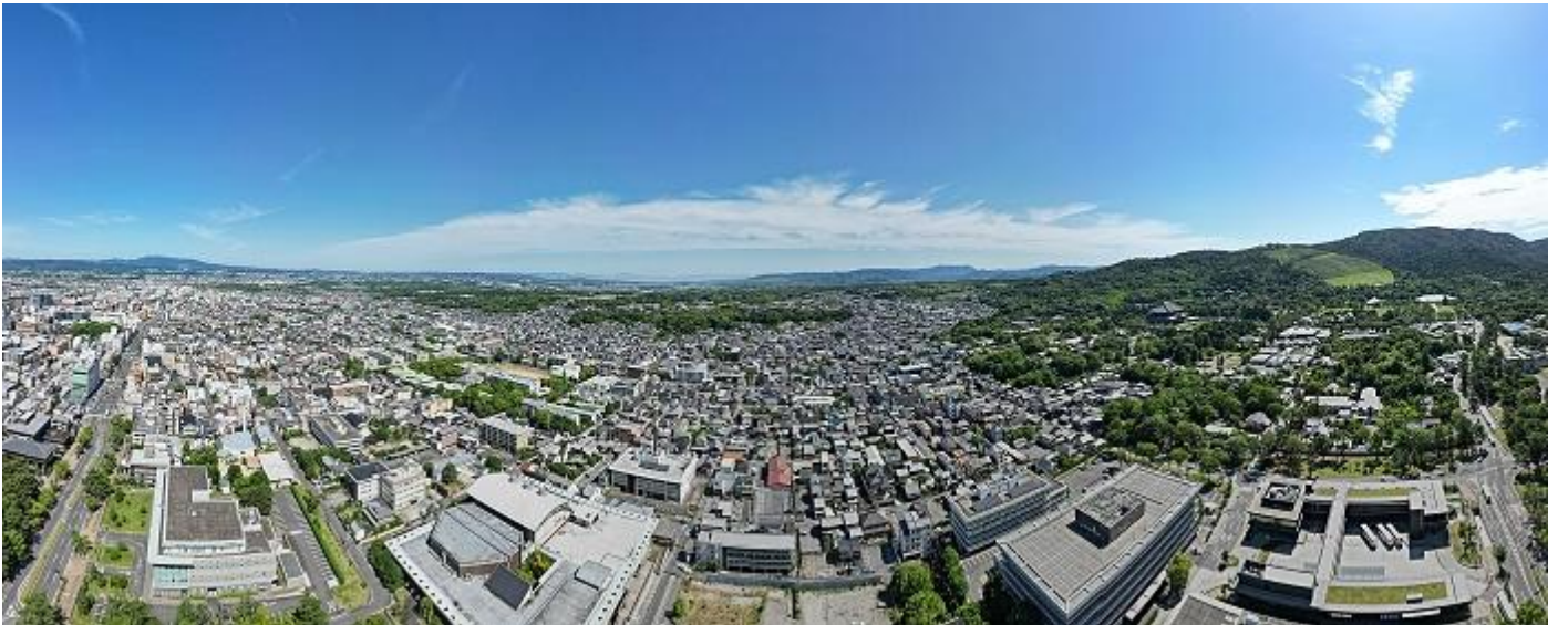
Luchtpanorama van Nara Park met uitzicht op de oude stad

In 1960 werd het officieel aangewezen als Nara Park onder de Urban Park Act, met een oppervlakte van 502 hectare.