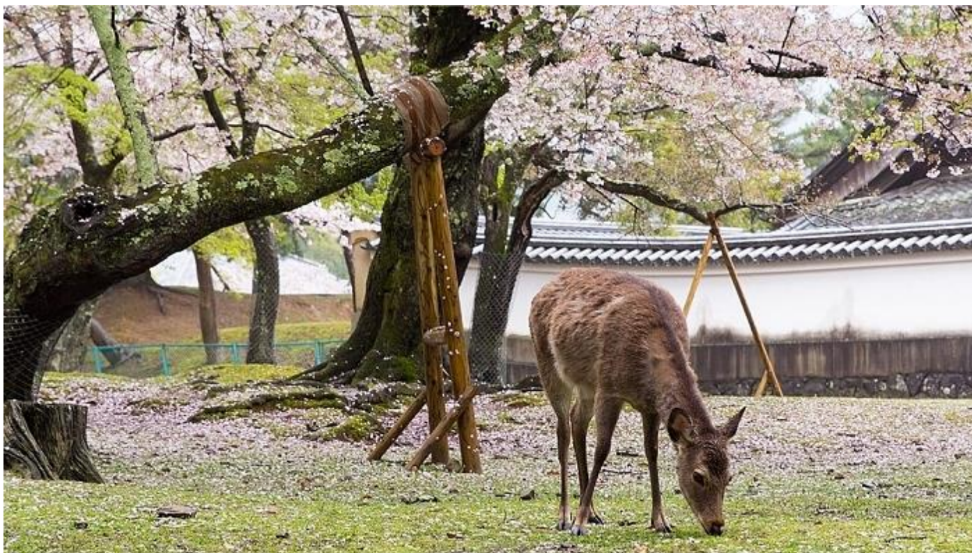
Shikahert in het park

Volgens de lokale folklore werden sikaherten uit dit gebied als heilig beschouwd vanwege een bezoek van Takemikazuchi, een van de vier goden van Kasuga Grand