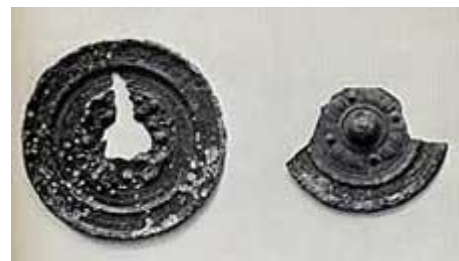
Nishin Nijukyo en Henkei Shijukyo, twee oude spiegels