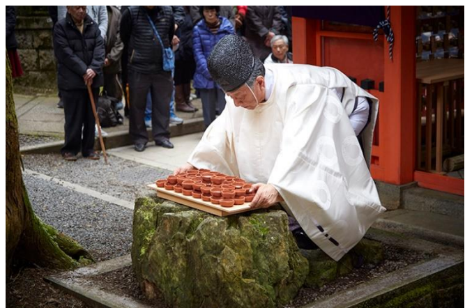
Offer van Sake aan de godheid

samenkomen, is dit een belangrijke plaats waar bezoekers bidden en de goden aanbidden die in de drie pieken wonen. De Oyama-sai-bergtopceremonie wordt elk jaar op 5 januari gehouden hier